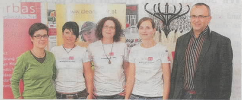
Das Arbas-Team bildet die Brücke zwischen Schule und Beruf.

Die Arbeitsassistenten (Arbas) hilft Menschen mit Handicap oder Förderbedarf und bei der Vermittlung eines Jobs. Auch in diesem Zeitraum werden die Jugendlichen von Arbas begleitet.